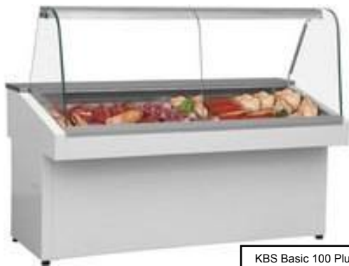
KBS Basic 100 Plus